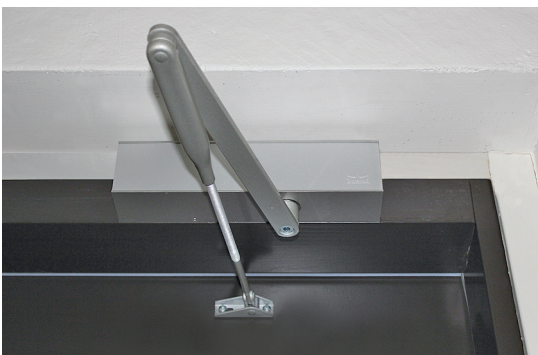
DORMA TS 83 ovisuljin. Kompakti laite pitää sisällään korkealuokkaiset ja monipuoliset suljintoiminnot.

Ovisulkimen kotelon väri on hopea. Kotelon mitat ovat pituus 245 mm * syvyys 46 mm * korkeus 60 mm.