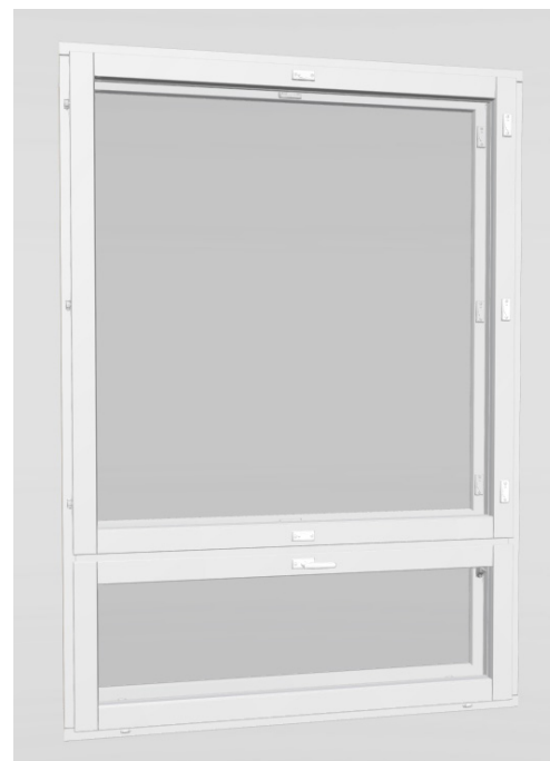
Kuva 2. Tyypillinen avattava ikkuna, jossa alasaranoitu tuuletusikkuna. AVR ei näy sisälle.