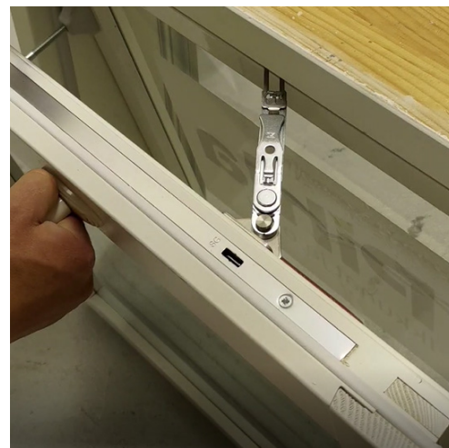
Kuva 1. AVR-lisärajoitin