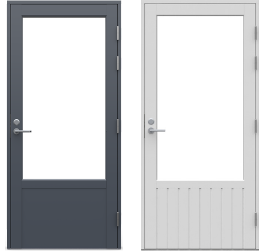
Umpiosa saatavilla sileänä tai paneeliprofiloituna.