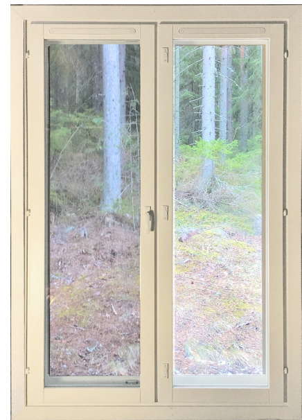
Maisema näyttää vain hiukan tummempalta Siitepölyverkon läpi.