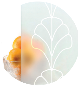
Designlasi D5 • Mallit S11, S12 ja M31