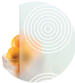
Designlasi D2 • Malli M40