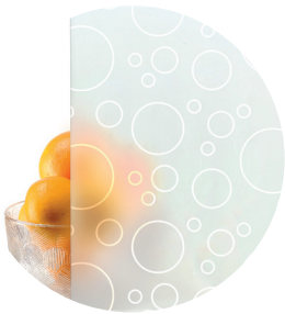
Designlasi D1 • Mallit M12, M23, M30, M31 ja M40