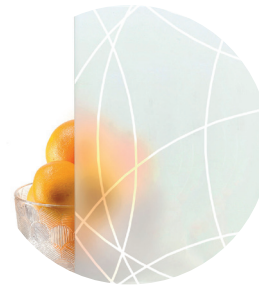
Designlasi D3 • Mallit M12, M23, M30, M31 ja M40