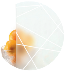
Designlasi D4 • Mallit M12, M23, M30, M31 ja M40