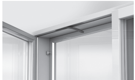
Suodattimen vaihto avattavassa ikkunassa.

Suodatin vaihdetaan avaamalla ikkunan puite ja poistamalla suodatin yläkarmista. Ilmakanavat sekä puitteen yläpuolelta että yläkarmista (venttiiliin yläpuolella) voidaan imuroida, kun suodatin on poistettu.